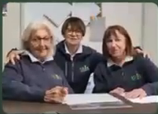
Responsabili del Servizio